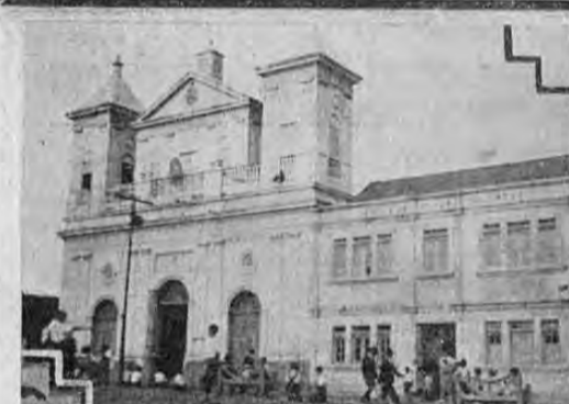
Iglesia de la Dolorosa de donde salió la imagen de la Virgen de Dolores para la procesion del encuentro el viernes santo.