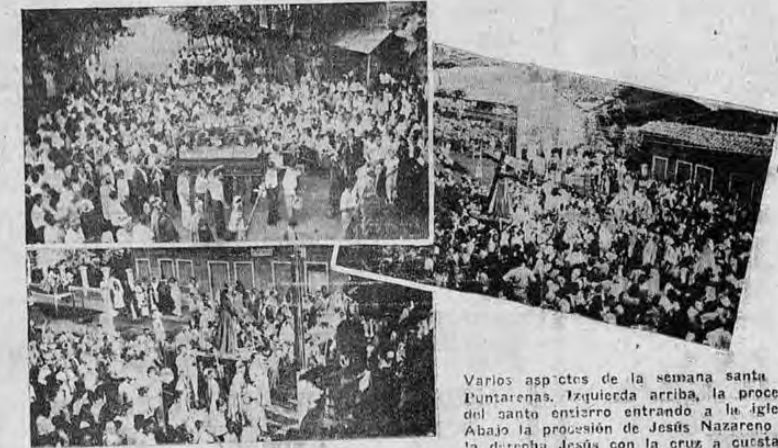
Varios aspectos de la semana santa en Puntarenas. Izquierda arriba, la procesión del santo entierro...