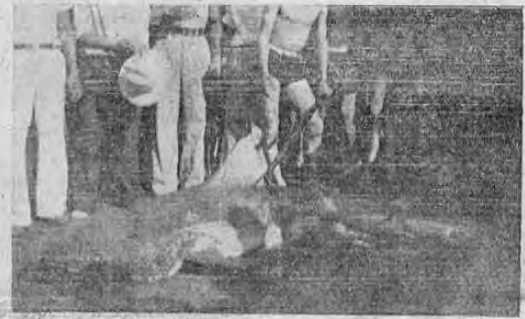
Nuestros lectores pueden ver, reproducida en el grabado, a la izquierda que el viernes santo se introdujo en la zona de matanza del banerario de Punitaremas Acerca del suceso nos ocupamos ampliamente en la edición del domingo.

LONDRES, 29. UP — El corresponsal diplomático del gran periódico liberal inglés, el "Manchester Guardian", considerado el más serio rotativo del mundo, informa, que 18 líderes de un complot para asesinar al general Franco fueron fuésilados, después de haberse descubierto una conspiración detrás de las líneas nacionalistas. La noticia ha causado enorme excitación en los círculos políticos y diplomáticos, pero el periódico se reserva su fuente de información, diciendo que el informe del complot contra la junta de gobierno nacionalista es verídico. Según dice el artículo el complot ya se había esparcido por varias ciudades del territorio dominado por las fuerzas del general Franco y según parece la trama tenía sus más numerosos adherentes en Málaga. La intención de los conspiradores era la de libertar los prisioneros de guerra en manos de los nacionalistas para lanzarse a un movimiento armado detrás de las líneas rebeldes. Afortunadamente el complot fué descubierto por el espionaje alemán establecido en todas partes en España, y que