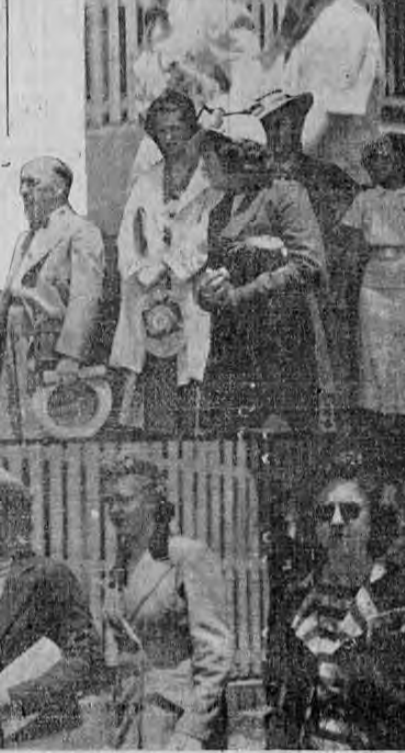
Recoge la cámara de LA TRIBUNA varios aspectos de la llegada de las bellas estudiantes del Gulf Park College de Gulfport, Mississippi...