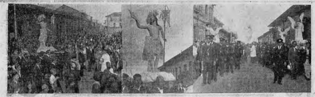
La cámara de Castillo recogió estas fotos de la tradicional procesion del resucitado que todos los años se celebra el domingo de pascua.