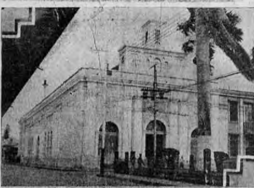
Iglesia parroquial del Carmen de donde salió la procesion del encuentro el viernes a las 11 de la mañana.