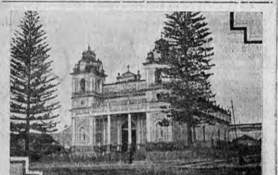
Iglesia de la Soledad de donde sale la procesion de la Virgen de la Soledad el sabado santo en la tarde...

Manufactured by the NUGGET... POLIFLOR simplifica el trabajo de encerar... PARA PISOS MUEBLES Y AUTOS