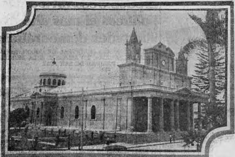
Fotografía de la Iglesia Catedral Metropolitana donde se celebraron con gran solemnidad los actos religiosos oficiados por el Excmo. señor Arzobispo Monseñor Castro...