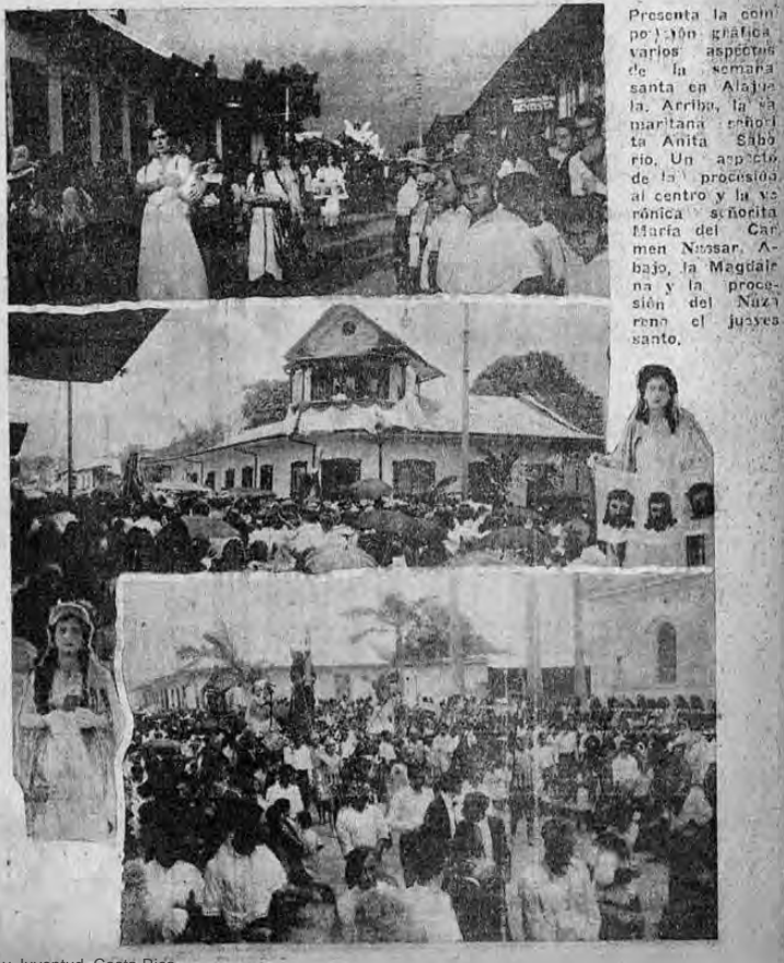
Presenta la comitiva un aspecto muy vistoso y variado. En el centro y a la izquierda, la procesión del santo entierro...